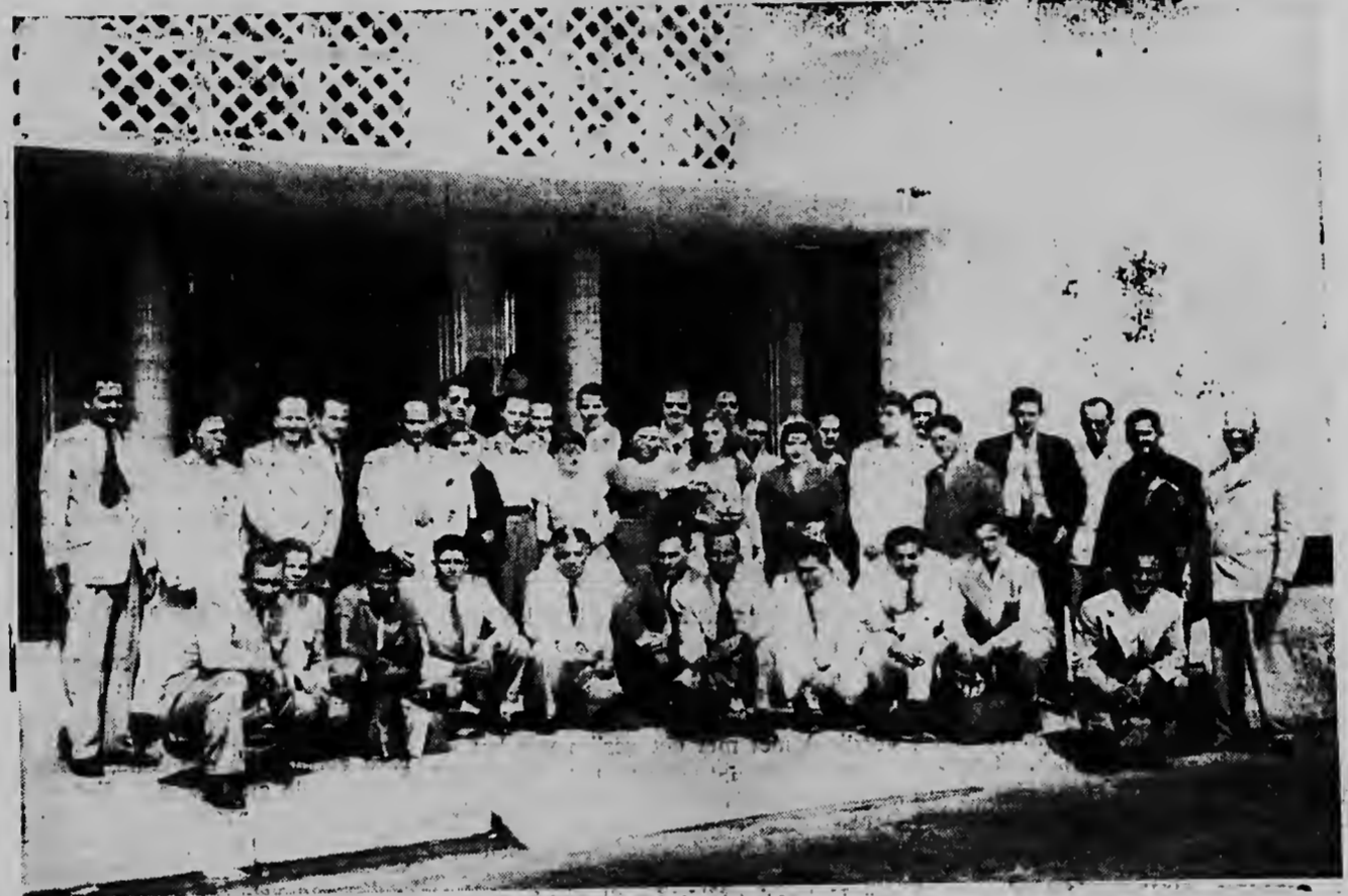
Ayera tardi a yega Aruba e voetbolploeg Venezolano na Dakoto, cuol team lo hungo den e voetbol-tournooi di Trappers. Aki nos lectoron por weita nan en medio di non huespednan na vliegveld.

Nos ta spera Trappers otro biaha mas hopi éxito den su tournooi. Y na e visitantenan un bon estadia riba Aruba, y cu nan lo goza di e weganan di nos muchanan.